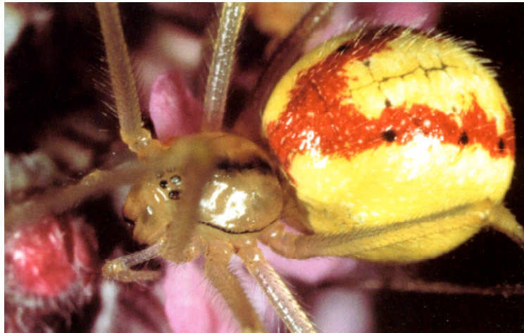
Abb.9: Enoplognatha ovata .