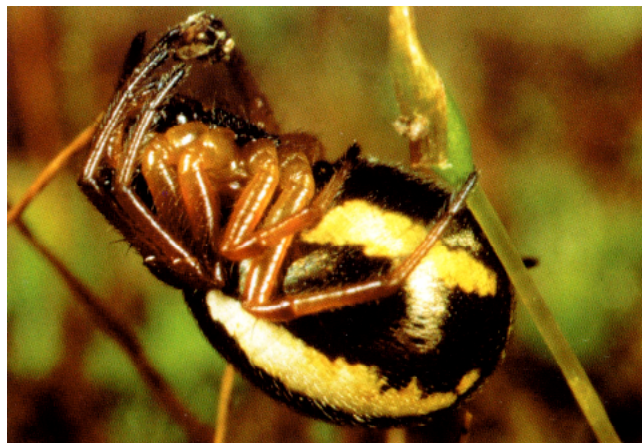
Abb. 7: Hypsosinga pygmaea .