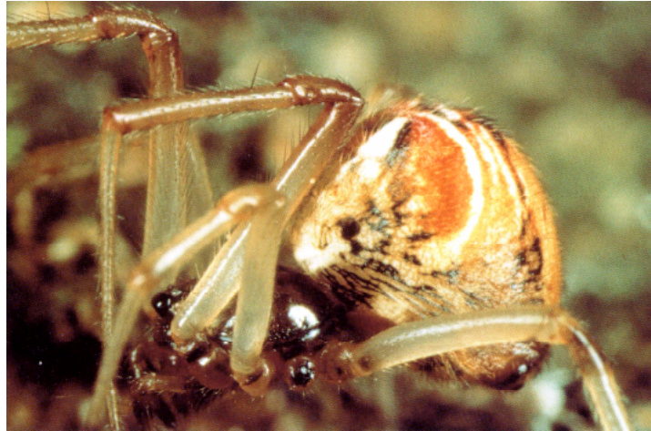
Abb. 8: Achaearanea lunata .