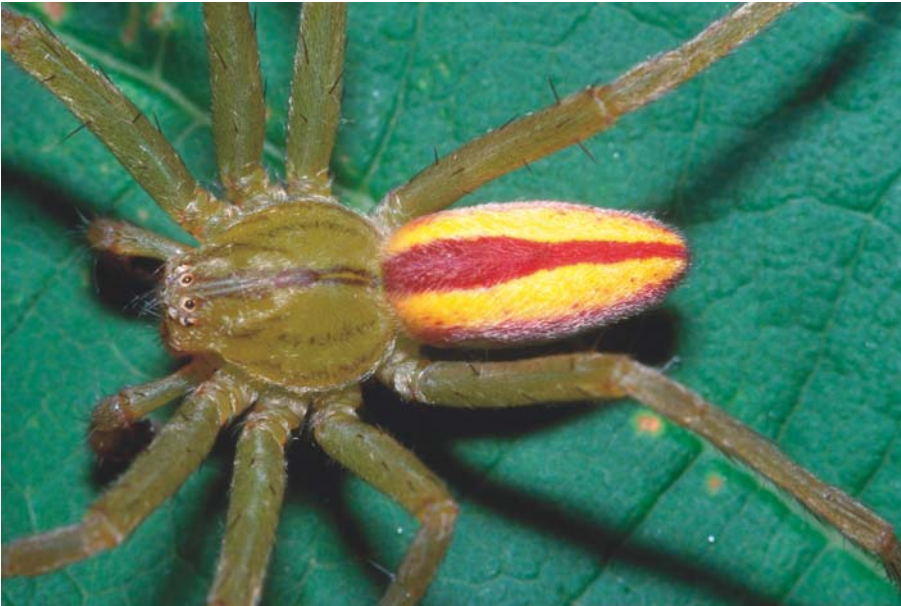
Abb. 4 | Das Männchen der Grünen Huschspinne ( Micrommata virescens ) ist eine der farbenprächtigsten Spinnen Mitteleuropas