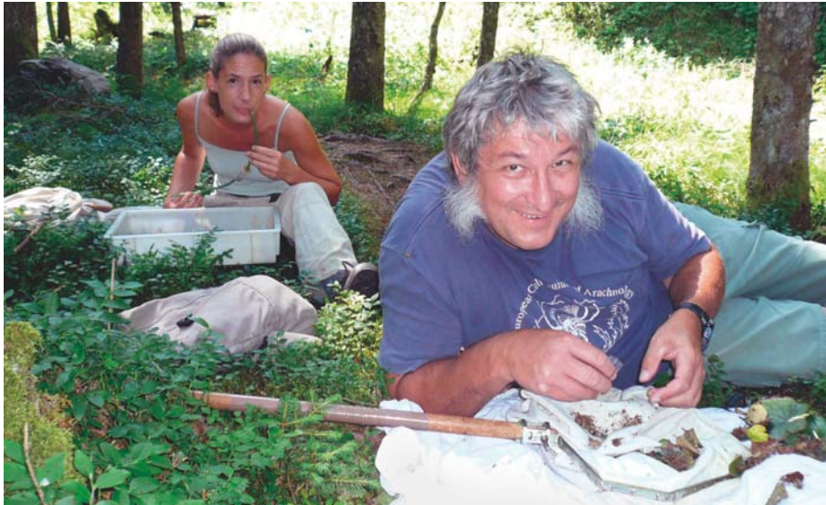
Abb. 1 | Arachnologinnen bei der Arbeit: Auslesen der Bodensieb- und Kescherproben | Foto: Ch. Komposch/ÖKOTEAM