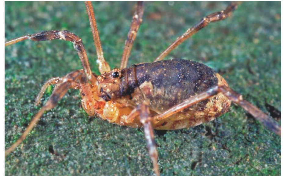
Abb. 12 | Der Gemeine Dreizackkanker ( Oligolophus tridens ), ein feuchtigkeitsliebender Bewohner der Waldböden, war bezüglich der Nachweisdichten die häufigste Weberknechtart des Untersuchungsgebietes | Foto: Ch. Komposch/ÖKOTEAM

Die Laubschicht wurde durchwühlt, die Bodenoberfläche beäugt und befallt, die Gras- und Krautschicht besaugt und bekeschert und selbst die Baumschicht ein wenig unter die Lupe genommen. Die außergewöhnlich hohe Dichte an ausschwärmenden Arachnologen zeigte Wirkung: mit 101 nachgewiesenen Spinnentaxa wurde der Artenreichtum der besammelten Lebensräume zwar keinesfalls vollständig erfasst, die Demonstration des hier