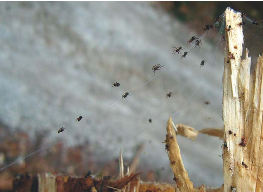
Abb. 5 | Die Nasenspinne Troxochrus nasutus wurde durch ihre auffälligen Massenauftritte in den letzten Jahren auch bei Nicht-Arachnologen bekannt | Foto: Ch. Komposch/ÖKOTEAM