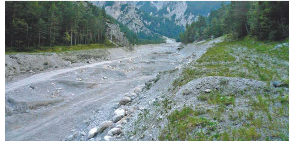
Abb. 11 | Der arachnologische Top-Standort des GEO-Tages 2007 war der Langgriesgraben