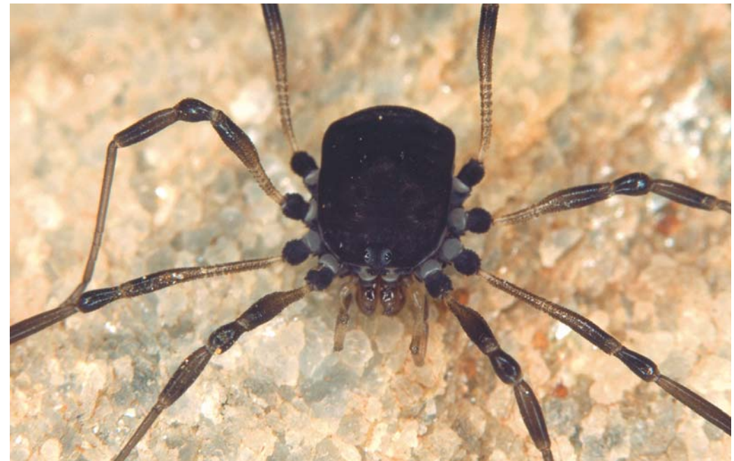
Abb. 9 | Der Schwarze Zweidorn ( Paranemastoma bicuspidatum ) wird aufgrund seiner ausgeprägten Hygrophilie auch als „Wasserweberknecht“ bezeichnet | Foto: Ch. Komposch/ÖKOTEAM

Der Schwarze Zweidorn ist ein Alpenendemit mit den meisten Funden in den Ostalpen (MARTENS 1978). Dieser Nemastomatide ist ausgeprägt hygrobiont und stets in Gewässernähe, Quellfluren und Bachauen anzutreffen. Bei Syntopie mit Paranemastoma quadripunctatum – wie auch im Untersuchungsgebiet an der Etbachquelle und dem Johnsbachufer im Schluchtbereich – findet sich Paranemastoma bicuspidatum immer in den deutlich feuchteren beziehungsweise nassen Bereichen ein.