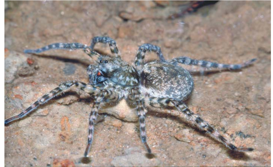
Abb. 14 | Die Gefleckte Bärin ( Arctosa maculata ) ist eine anspruchsvolle Bewohnerin von Feuchtlebensräumen der kollin-montanen Stufe

Die Kenntnis unserer Landesfauna wurde um drei Spinnenarten aus drei Familien bereichert ( Trichoncus hackmani , Zelotes zellensis , Sitticus atricapillus ) und für weitere achtbeinige Besonderheiten wurden wertvolle Daten zur Verbreitung und Ökologie erhoben. Der aus vorangegangenen Forschungsprojekten bereits bekannte hohe naturschutzfachliche Wert der ripicolen Spinnengemeinschaften der Ennsufer wurde bestätigt. Die bislang unerforschten Feuchtflächen im Bereich der Etbachquelle erwiesen sich als Habitat mehrerer sehr seltener und hochrangiger Rote-Liste-Arten als überaus wertvoll. Ähnliches gilt für die naturnahen Abschnitte der Johnsbachufer mit den bachbegleitenden Au- und Schluchtwäldern sowie die Lettmairau, die Lebensraum zahlreicher stenotop-hygrophiler Weberknecht- und Spinnenarten ist. Als Sonderstandort von herausragender naturschutzfachlicher Bedeutung ist aus arachnologischer Sicht die kalkschuttdominierte Erosionsrinne des Langgriesgrabens hervorzuheben.