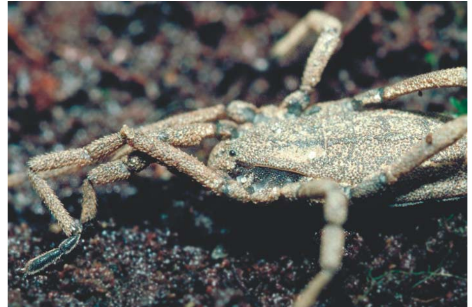
Abb. 6 | Der Kleine Brettkanker ( Trogulus tricarinatus ) gibt dem Arachnologen noch große Rätsel hinsichtlich exakter Artzugehörigkeit auf | Foto: Ch. Komposch/ÖKOTEAM