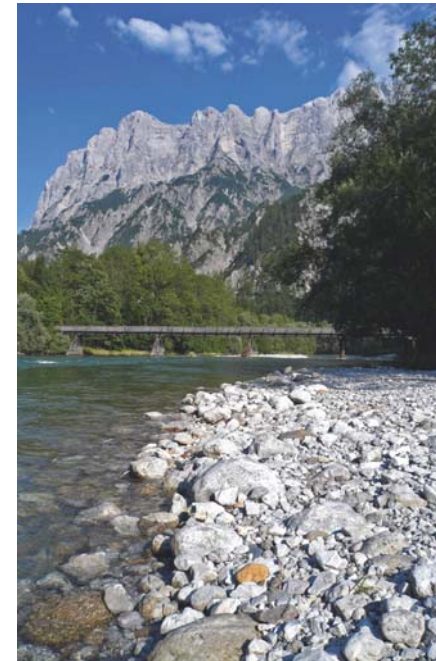
Abb. 2 | Lebensraum anspruchsvoller und gefährdeter Spinnenarten – die Schotterbänke der Enns nahe der Johnsbachmündung | Foto: Ch. Komposch/ÖKOTEAM