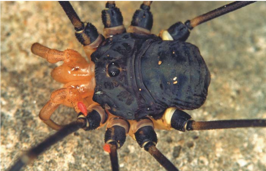
Abb. 10 | Der Schwarze Riesenweberknecht ( Gyas titanus ) stellt eine gefährdete Flaggschiffart von Bach-, Fluss- und Schluchtlebensräumen im Nationalpark Gesäuse dar | Foto: Ch. Komposch/ÖKOTEAM

Der Schwarze Riesenweberknecht, eine disjunkt europäisch-montan verbreitete Art, fehlt im äußersten Osten Österreichs. Gyas titanus ist eine stenotop-hygrophile Art, ihr Vorzugshabitat sind feucht-kühle Bachschluchten. Hier lebt Gyas an nassen, zum Teil wasserüberrieselten Felsen und in Felsspalten (KOMPOSCH & GRUBER 2004). Im Untersuchungsgebiet ist die gefährdete Art als selten einzustufen: es gelang lediglich ein Nachweis weniger Tiere in einem moosigen Schluchtwald am Johnsbachufer.