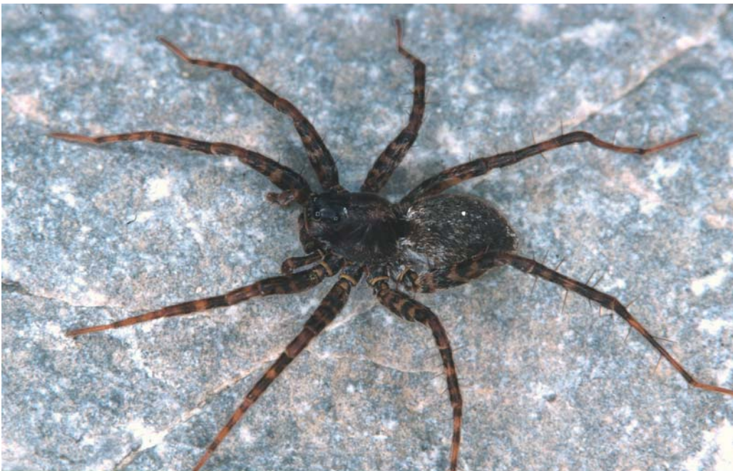
Abb. 8 | Die Wolfspinne Pardosa wagleri ist die Charakterart vegetationsoffener und dynamisch umgelagerter Schotterflächen im Langgriesgraben und an den Ennsufern | Foto: Ch. Komposch/ÖKOTEAM

Diese mittelgroße Wolfspinne ist ein stenotop-ripicoler Bewohner von Schotterbänken an Flussufern. Im Alpenraum ist Pardosa wagleri auf tiefe Lagen beschränkt und wird ab ca. 1.000 Meter Seehöhe von der Schwesterart P. saturator ersetzt (BARTHEL & HELVERSEN 1990, STEINBERGER 1996). Pardosa wagleri ist eine stark gefährdete und anspruchsvolle Charakter- und Leitart von Flussufern mit einem dynamischen Geschlechtsverhältnis in tieferen Lagen. Die Fortpflanzung findet im Frühjahr und Sommer, die Überwinterung im juvenilen oder subadulten Stadium statt (MANDERBACH 2001). Im Untersuchungsgebiet besiedelt die Art sowohl die Schotterbänke der Flussufer als auch Erosionsrinnen wie den Langgriesgraben.