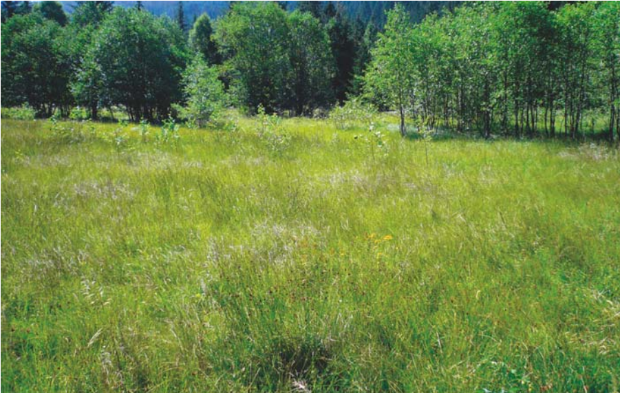
Abb. 13 | In den Mooswiesen nahe der Etbachquelle konnten hochrangige Rote-Liste-Spinnenarten nachgewiesen werden

vorhandenen Biodiversitätspotenzials gelang jedoch auf eindrucksvolle Art und Weise. Die bemerkenswerten 18 nachgewiesenen Weberknechtarten machen im artenreichen Nationalpark Gesäuse etwa 70 % des opilionologischen Inventars aus.