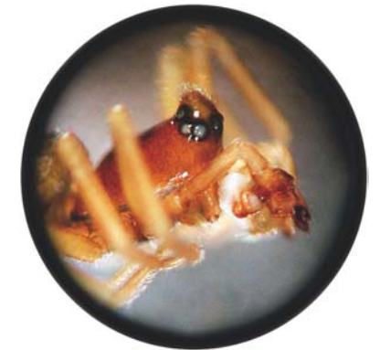
Abb. 7 | Die nur 1,5 Millimeter „große“ Zwergspinne Janetschekia monodon ist an ihrem zipfelförmig ausgezogenen und behaarten Kopf gut zu erkennen

Diese uferbewohnende Zwergspinne ist aus dem Alpenraum (Österreich, Schweiz, Deutschland) und aus Italien bekannt (PESARINI 1995, BLICK et al. 2004). Sie besiedelt Kiesfluren und Flussgeröll und dringt als euryzonale Art bis zum Gletscherrand vor (THALER 1978, 1999). STEINBERGER (1996) konnte sie an Schotterbänken des Lech nachweisen, KOMPOSCH (2004; unpubl.) fand sie an einer Schotterbank an der Oberen Drau bei Spittal und in hohen Dichten auf einem schottrigen Naturdach im Mittleren Murtal. Im Gesäuse wurde dieser Pionierbesiedler auf den Schotterflächen der Johnsbachmündung in die Enns entdeckt.